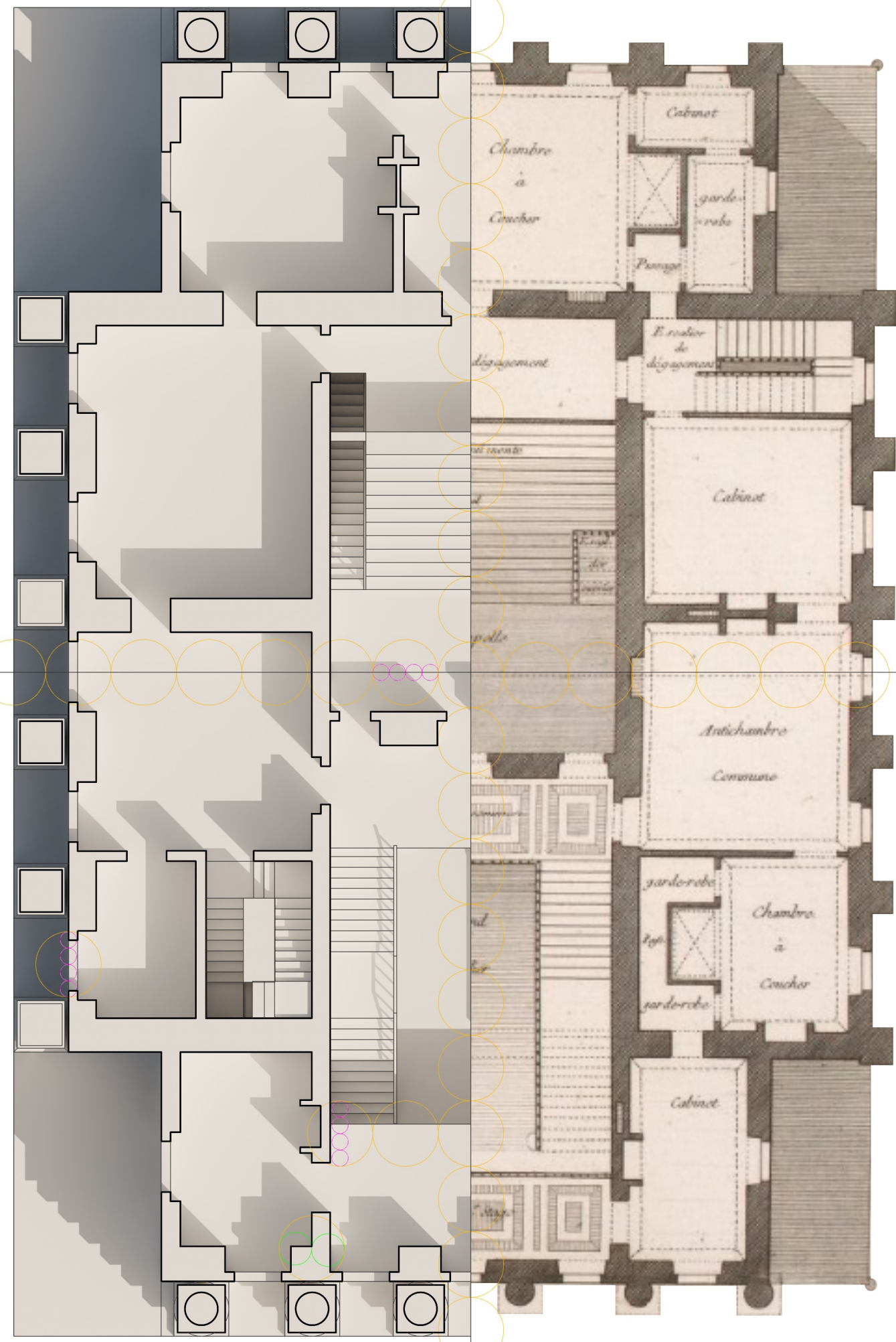
Ricostruzione pianta piano tre