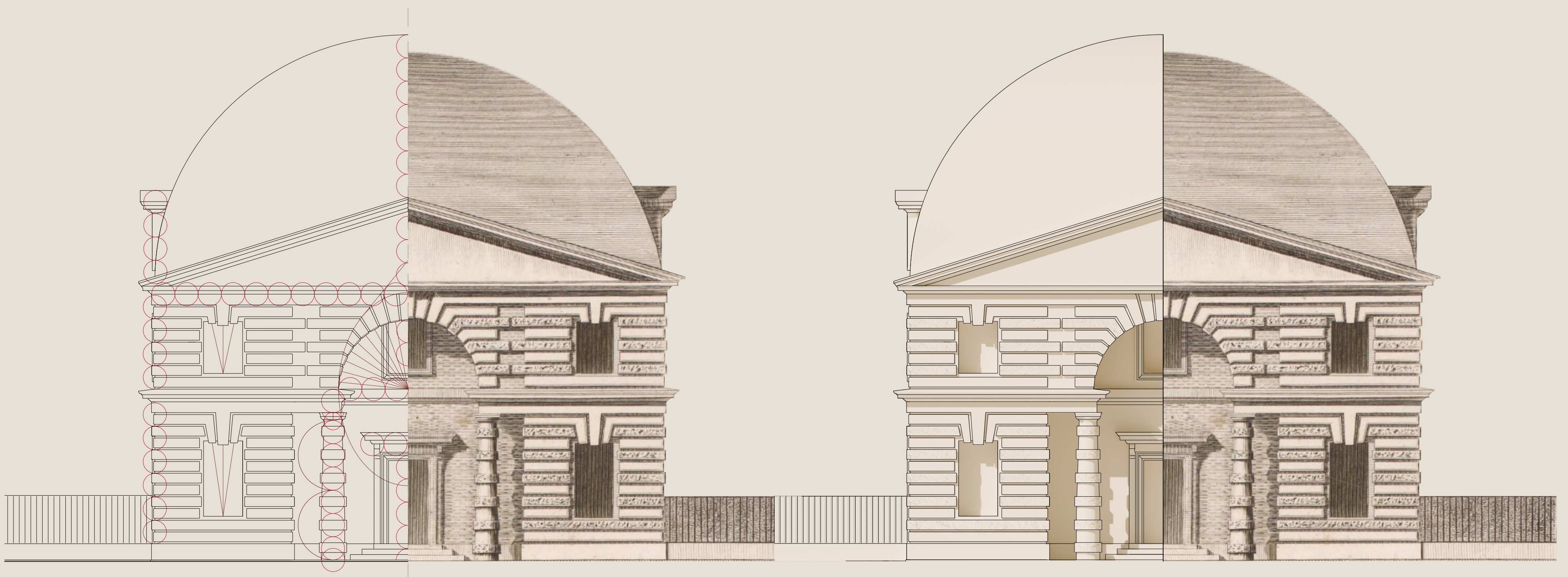
Prospetto frontale con analisi del modulo